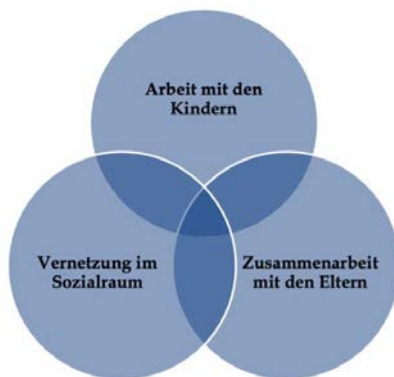
Abbildung 2 Trias Kita als Lern- und Lebensort

Hinweis: Die Kindertageseinrichtung ist ein Lern- und Lebensort für Kinder und Familien und im Zentralen geht es um die Trias Arbeit mit den Kindern, Zusammenarbeit mit den Eltern sowie Vernetzung im Sozialraum.