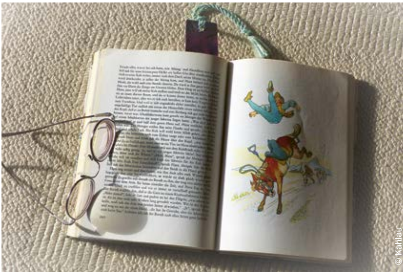
Abbildung 1: Der vergleichende Blick in den Originaltext eines Märchens lohnt sich auf jeden Fall – sowohl in der Planungsphase als auch in der Umsetzungsphase einer Biografiearbeit