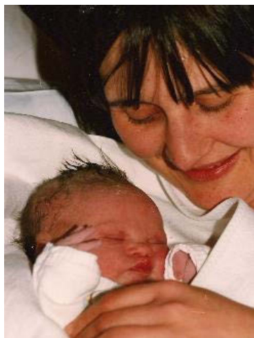
Foto 3 Glückliche Mutter mit Baby

An meine Kindergartenzeit kann ich mich gar nicht mehr gut erinnern, da ich Selbst noch ein Kleinkind war, meine Mutter erzählte mir davon. Und ich Schreibe mit. Ich kann mich noch daran erinnern, an meine Erzieherin, die ich hatte. Und die war mit mir sehr sehr nett und auch voll lieb mit mir. Für mich gab es immer ein Zivi, und jedes Jahr gab es dann wieder mal ein Wechsel. Darum kann ich mich nicht mehr an meine Zivis erinnern.