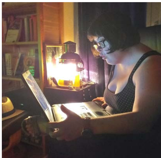
Foto 2 Abendlesung mit der ersten Textfassung