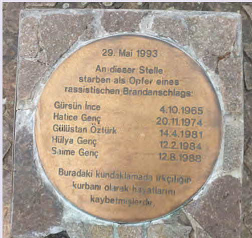
Gedenkstein auf der Unteren Wernerstraße in Solingen