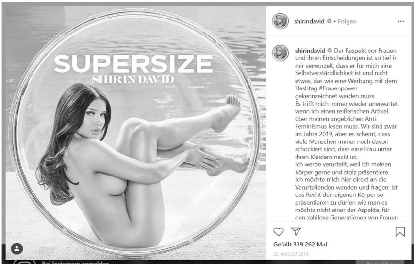
Abb. 1: Verquickung von Rap, sexpositiven Feminismus und Konsum (David 2019a).

komplett nackt von hinten mit ihrem großen runden glänzenden Po zu sehen ist. Ganz im Sinne der Cover-Story „Break the Internet“ hat Kardashian ein Körperbild popularisiert, welches aus der HipHop- und Dancehall-Kultur stammt, sich dem Schönheitsideal Schwarzer Frauen und Künstler*innen aneignet (siehe unten) und Schönheits-OPs zelebriert (Halleinstein 2018, o. S.).