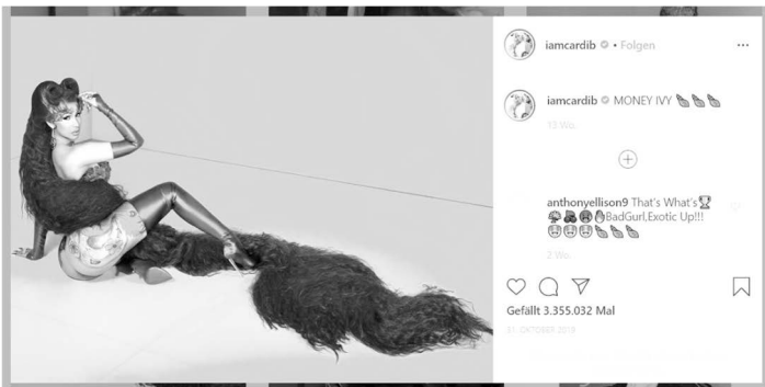
Abb. 2-4: Selbstmarketing von Nicki Minaj und Cardi B in der Tradition David LaChapelles (Minaj 2018, o. S.; Minaj 2019, o. S.; Cardi B 2019, o. S.)