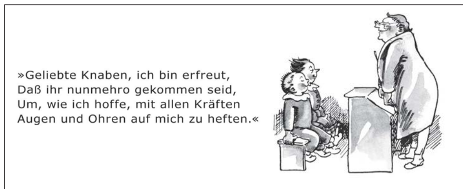
Abb. 1: Plisch und Plum (Wilhelm Busch)

Wilhelm Busch beschreibt und illustriert in seiner Geschichte von Plisch und Plum seine Vorstellung von Lehren: