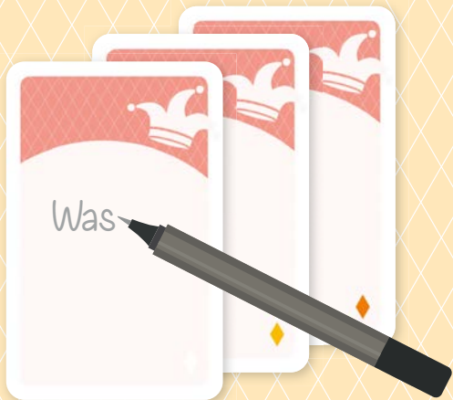
Freie Joker-Karte zum Selbstbeschriften = 2 Punkte

Drei leere Joker-Karten können mit eigenen Fragen und Ideen beschriftet werden oder sie werden als freie Joker-Karten mitgespielt. Mit ihnen ist jede Frage erlaubt. Wer die freie Joker-Karte zieht, kann sich selbst eine Frage stellen oder einen Mitspieler darum bitten.